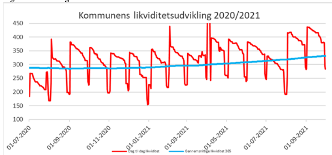
Figur 1: Udvikling i kommunens likviditet