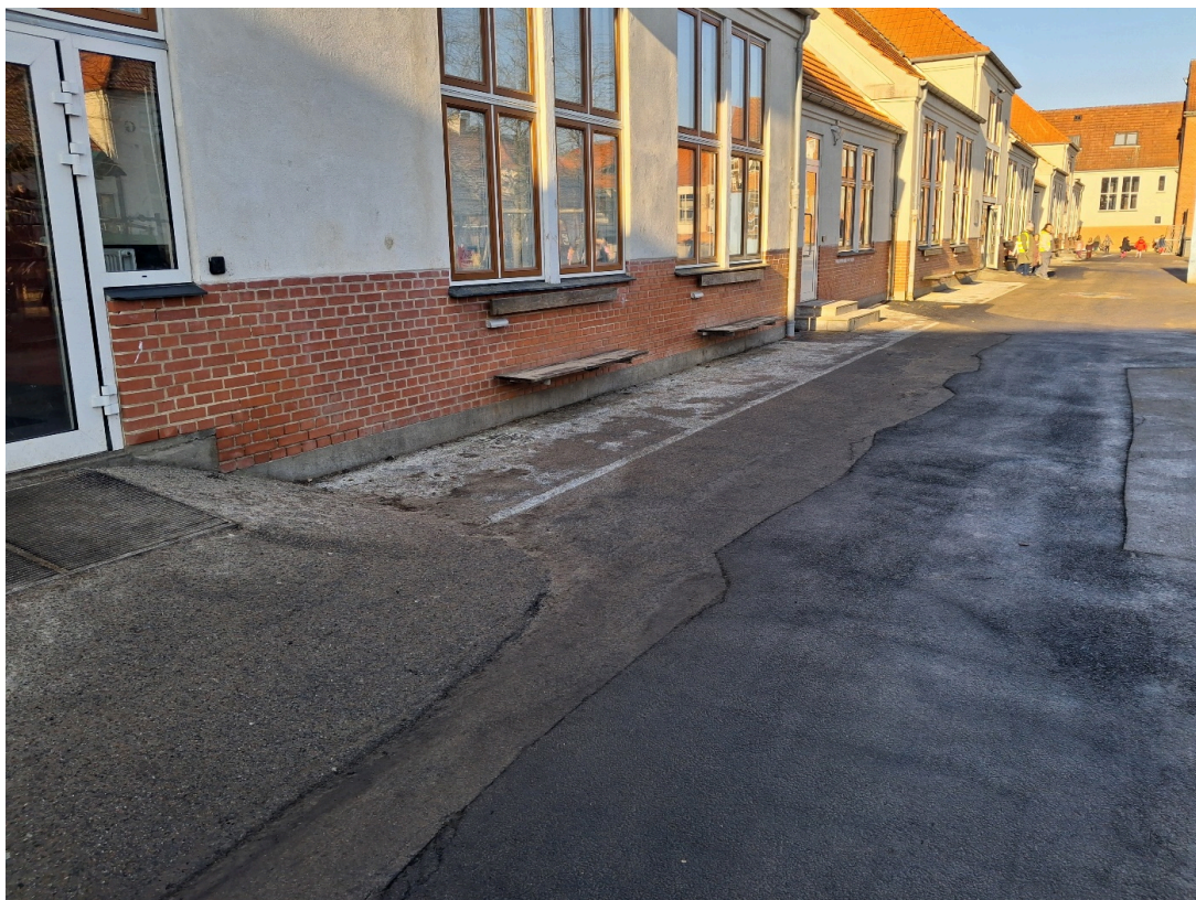
Skolegården på Valdemarskolen er efter opgravning lappet med asfalt i felter.

Efter gravearbejdets afslutning af etape 1, er der et forventet mindreforbrug på 2 mio. kr., som var dedikeret til denne etape af kloakarbejdet. Dette mindreforbrug skyldes entrepriser for etape 1 og 2, som har ligget væsentligt under det forventede resultat, samt færre ekstraudgifter i forbindelse med arbejdet. Det vil være muligt at bruge dette overskud på at renovere legepladsen i stedet, så der vil være et samlet budget på 3 mio. kr. til opgaven. Det vil betyde at der kan udføres en samlet, sammenhængende og tiltrængt renovering af skolegård og legepladser.