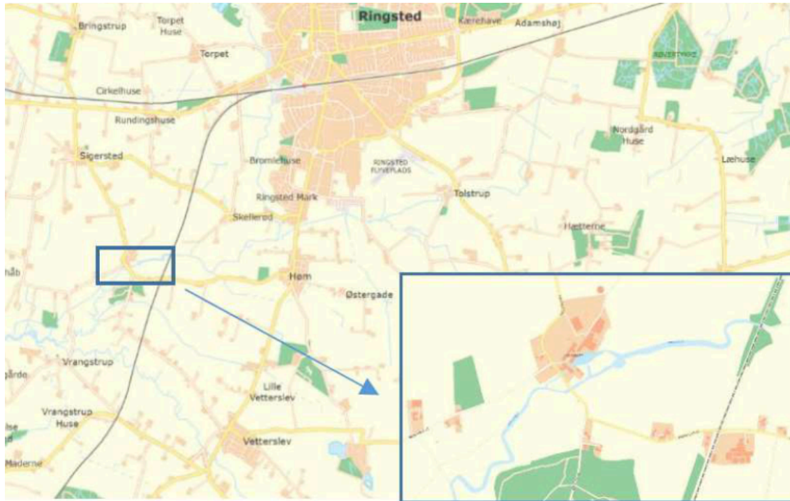
Figur 1 Projektområdet

ved Englerup Mølle sydvest for Ringsted by.