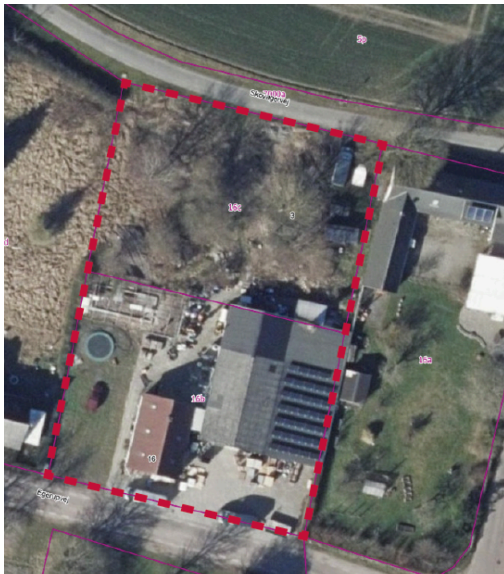
Luftfoto viser forslag til kommuneplantillæggets og lokalplanens afgrænsning.