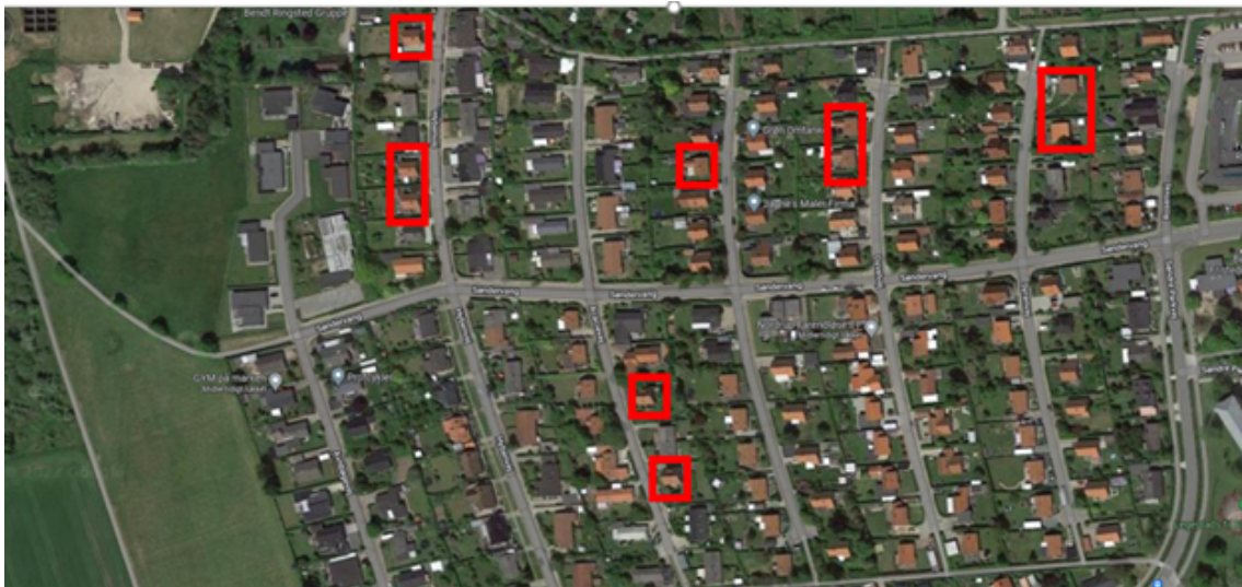
Oversigtskort over placeringen af matriklerne i afdeling 38 i det vestlige Ringsted.

Afdeling 38 er beliggende på Hybenvej 4,12 og14, Acacievej 15 og 19, Gyvelvej 6 og 8, Tjørnevej 8 samt Syrenvej 3 og 5.