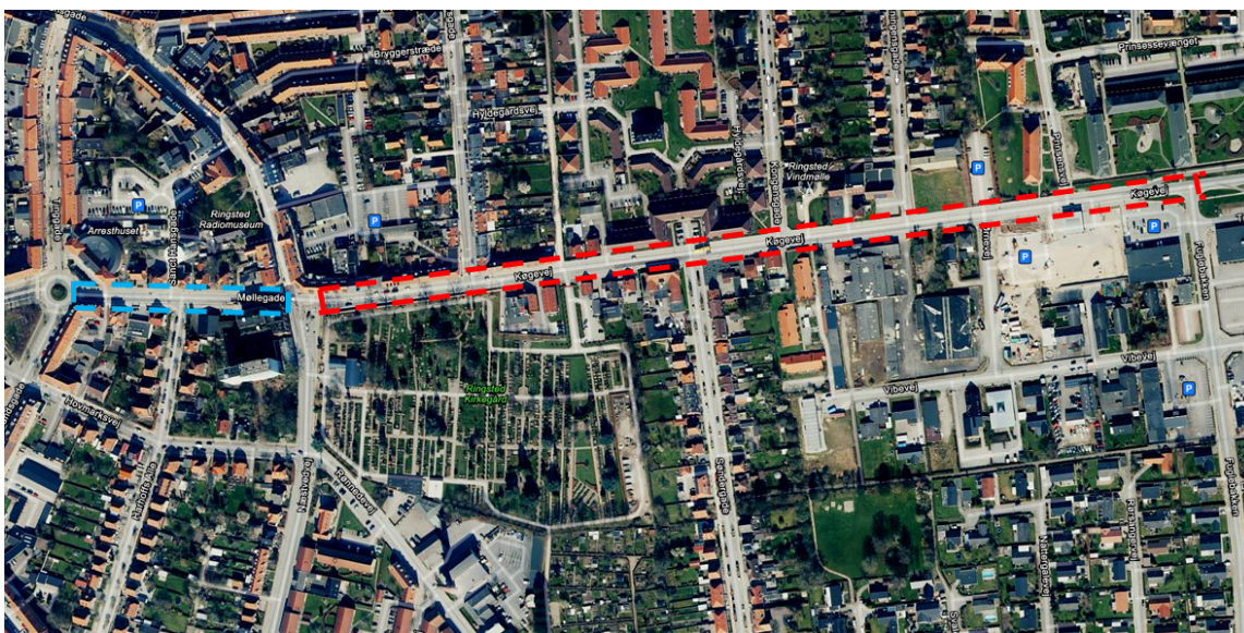
Figur 1:Oversigt over projektområdet

Byrådet besluttede den 6. december 2021 pkt. 16, at bevillige 1,0 mio. kr. til projektering af cykelsti på ÅKÅ,gevej. Byrådet har ligeledes besluttet den 22. juni 2022 pkt. 20 at acceptere tilsagn om tilskud fra Vejdirektoratets Cykelpulje 2022 på 2,641 mio. kr. til projektering og anlÅggelse af cykelsti på ÅKÅ,gevej.